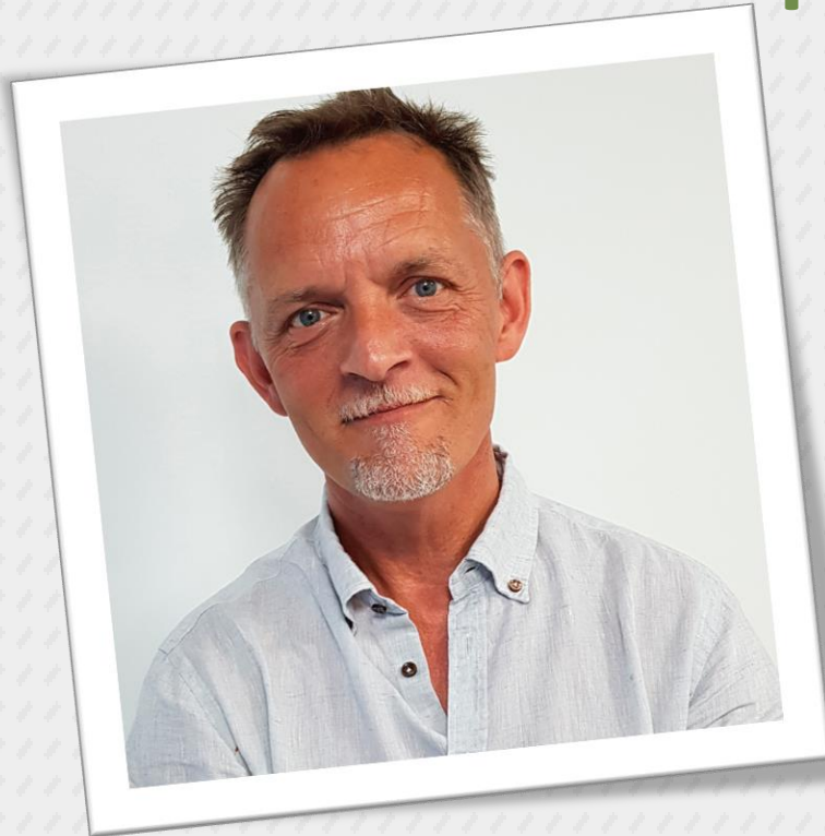
CEO Blue Workforce