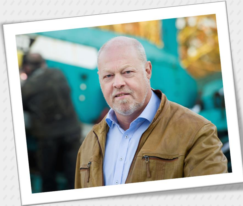
Branchechef Industri Arbejdsgiverne