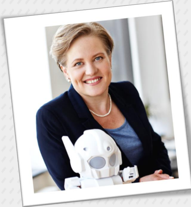
CEO Grouleff Communications

Generelt er jeg meget stor fan af brugervenlige, intuitive robotopfindelser, som alle kan hitte ud af at betjene som et nyttigt værktøj i deres arbejde, i deres hjem eller andetsteds. Her synes jeg, at Danmark har en perlerække af robot-frontløbere, som bygger videre på vores stærke tradition for tværfagligt samarbejde, brugerdreven innovation og fokus på enkelhed og overskuelighed.