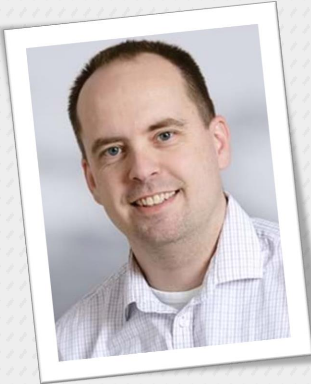
Chefkonsulent Dansk Industri