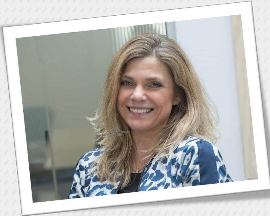
Videnscenter Chef UCL