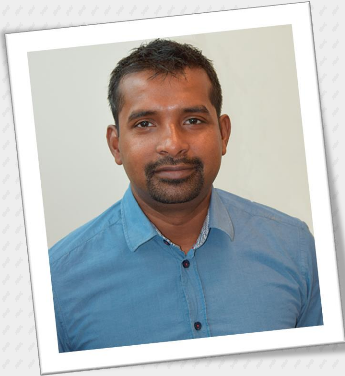
Associate Professor SDU Robotics